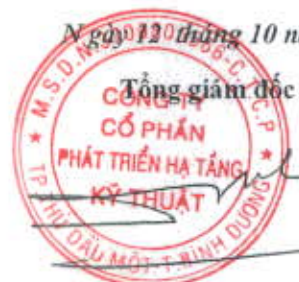
ĐỖ QUANG NGÔN